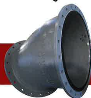
フランジ形片落曲管