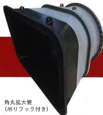
角丸拡大管 (吊りフック付き)