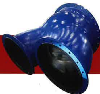
フランジ形特殊分岐管