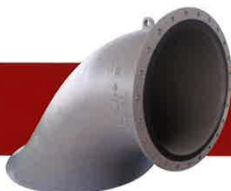
フランジ形らっば曲管 (吊りフック付き)